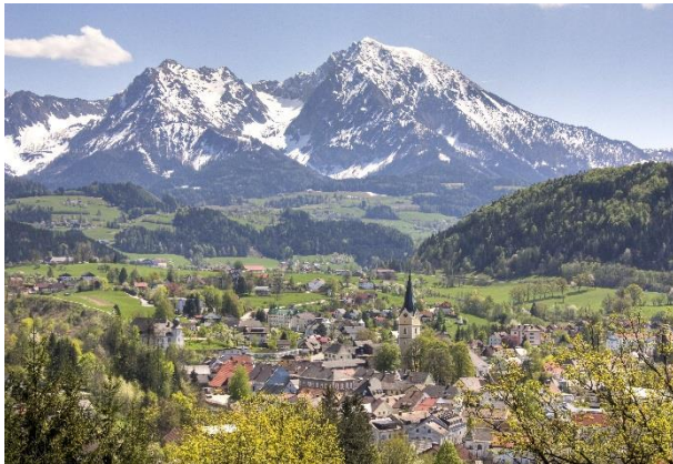
Blick auf Windischgarsten

Termin: Freitag, 05.07. - Sonntag, 07.07.2019 / 3 Tage